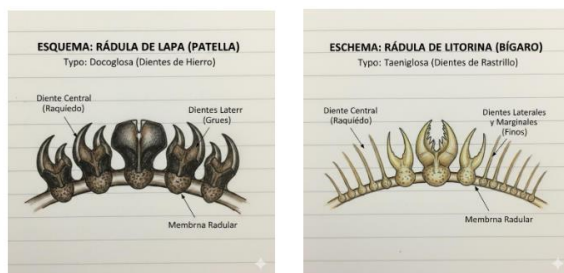
Tabla para comparar los dos tipos de rádulas

(La rádula de la Patella (Lapa) es famosa por ser uno de los materiales biológicos más fuertes del mundo (contiene un mineral llamado goethita), mientras que la de la Littorina (bígamo) está adaptada para un raspado más flexible)